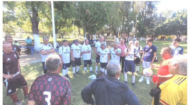
Terminada la final, premiación de la categoría diamante.