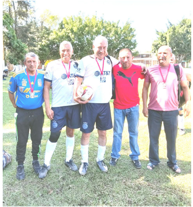
INDEPENDENCIA, tercer lugar categoría diamante.

Es todo por esta semana, con información limitada porque estoy en el Hospital del IMSS, en espera de una operación por fractura en uno de mis pies, confiando en la capacidad y profesionalismo de médicos y enfermeras, a quienes manifiesto mi gratitud. Hasta la próxima.