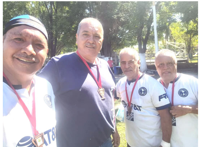
Muy felices, jugadores del equipo Independencia.

que quedó fuera de liguilla, y que se ganó el derecho en la cancha, pero que por reglamento lo perdió en la mesa.